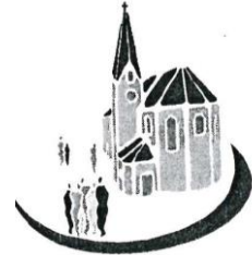
Mariä Himmelfahrt Kirchberg (KB)

I n dieser Situation der Pandemie, in der wir mehr oder weniger isoliert leben müssen, sind wir aufgerufen, den Wert der Gemeinschaft, die alle Mitglieder der Kirche vereint, wiederzuentdecken und zu vertiefen. Mit Christus vereint sind wir nie allein , sondern bilden einen einzigen Leib, dessen Haupt Er ist. Es ist eine Einheit, die durch das Gebet und auch durch die geistliche Gemeinschaft in der Eucharistie genährt wird, eine Praxis, die sehr zu empfehlen ist, wenn es nicht möglich ist, das Sakrament zu empfangen.