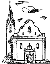
St. Laurentius Ramspau (RA)