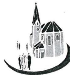
Mariä Himmelfahrt Kirchberg (KB)

St. Michael Heilinghausen (HH) – St. Dionysius Hirschling (HL) Schloßkapelle St. Ulrich Karlstein (KS) und Spindlhof (SH)